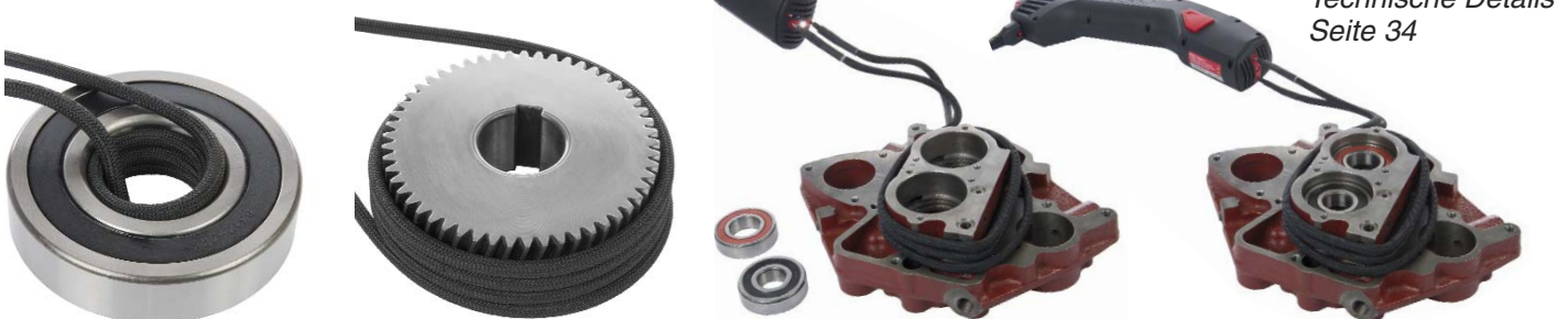
Technische Details Seite 34