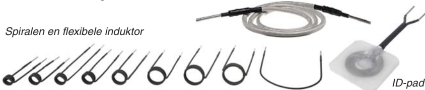
Flexible Induktor zur Erwärmung verschiedenen Komponenten